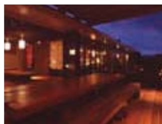
古酒 BAR 山桜 (名護市)