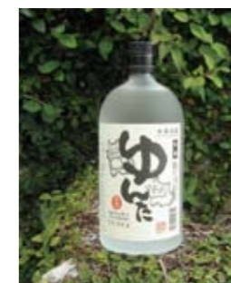
三井物産 PB 泡盛『ゆんた』