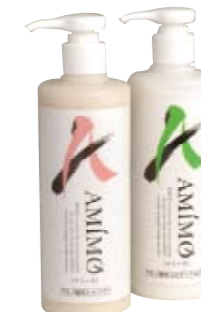
『アミーモ シャンプー&リンス』